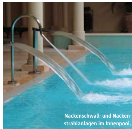
Nackenschwall- und Nackenstrahlanlagen im Innenpool.

Während oben im Erlebnispool solche Dinge wie Wassergymnastik, Aqua-Fitness und ähnlich schweißtreibende Aktivitäten gefragt sind, können die Gäste in dem warmen