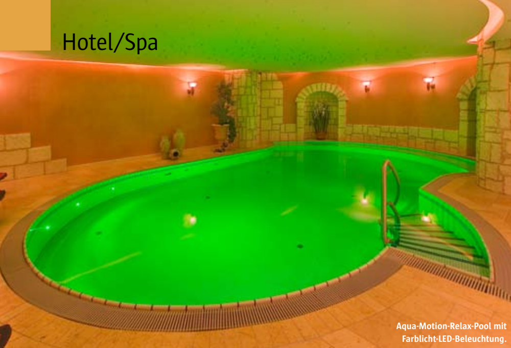
Aqua-Motion-Relax-Pool mit Farblicht-LED-Beleuchtung.

Sitze mit Luftsprudeleinrichtung, Massagedüsen, Bodengeysire und verschiedene Nackenschwall- und Nackenstrahlanlagen. Eine breite Einstiegstreppe erlaubt den bequemen Ein- und Ausstieg. Wohnzimmeratmosphäre verbreiten die Vorhänge vor den Fenstern, die Separées, in denen die Gäste ungestört verweilen können, und natürlich der offene Kamin. Gerade abends, wenn das Feuer im Kamin lodert, und das Leben im Hafen zur Ruhe kommt, ist die entsprechende Wohlfühlstimmung garantiert. Auf einer Empore über dem Pool kann man ebenfalls ungestört den Blick über die Hafenanlage und die Ostsee genießen.