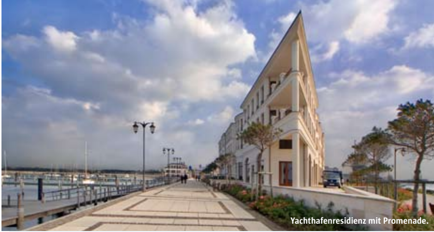
Yachthafenresidenz mit Promenade.