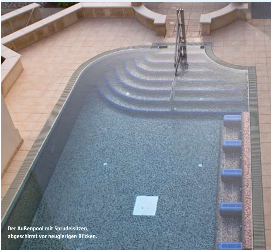
Der Außenpool mit Sprudelsitzen, abgeschirmt vor neugierigen Blicken.

Einsendeschluss ist der 8. September 2008. Der Rechtsweg ist wie immer ausgeschlossen.