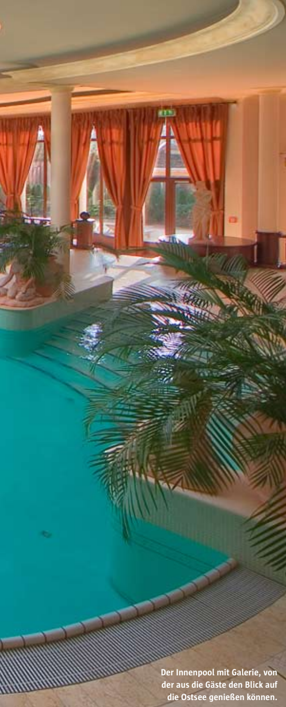
Der Innenpool mit Galerie, von der aus die Gäste den Blick auf die Ostsee genießen können.

in einem einzigartigen Wellness-Konzept integriert. Weitaus weniger waren die verschiedenen Pools Gegenstand der Berichterstattung. Aber auch hier hat das Resort einiges zu bieten. Gleich vier Schwimmbecken stehen für die Erholungssuchenden bereit. „Kernstück des Angebots“, erläutert Sven Kühne vom Schwimmbadbau-Unternehmen Kühne Pool & Wellness, das den Auftrag für die schwimmbadtechnischen Arbeiten bekommen hatte, „ist ein Panorama-Erlebnis-Hallenbad mit Blick auf den Yachthafen und die Ostsee“. Der Pool bietet mit 22 x 10 m ausreichend Schwimmfläche, aber auch eine üppige Attraktionsausstattung. Dazu gehören eine Gegenstromanlage für den Fitness-Schwimmer und verschiedene Entspannungsangebote, so z.B. mehrere