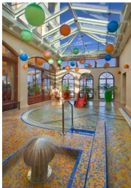
Fröhliches Treiben: Kinderbecken mit eigenem Schiffchenkanal.

Eine Etage tiefer erwartet den Gast eine ganz andere Art von Schwimmbecken: der Aqua-motion-Relax-Pool. Der Name ist Programm: Nicht das aktive Schwimmtraining ist hier gefragt, sondern entspanntes Relaxen, sich treiben lassen in dem 34° C warmen Wasser.