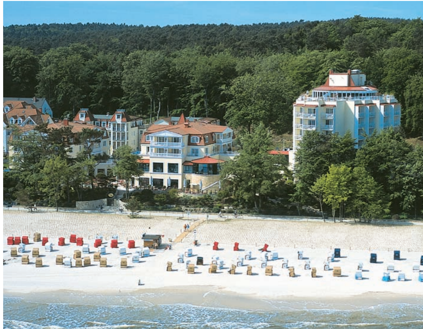
Bildlegende, Blindtext Bildlegende: tatum atque appetitionum sunt cau- sae naturales at antece- dentes; nam nihil esset nostra potestate sehave- ret. Nunc vero fatemur, acuti hebetesne, valentes imbecilline simus, non esse id in nobis, qui

Verfügung. Wie das funktioniert, beschreibt der Schwimmbadbauer: „Das Kunststoffbecken wurde ans alte Becken angeflanscht und darüber eine Dichtung gebracht. Dann wurde die vorhandene Überlaufrinne durchgezogen zum neuen Pool. Und das VPS-Becken wurde schließlich mit den gleichen Fliesen ausgekleidet wie das vorhandene Becken.“ Da der alte Pool bereits mit Wasserattraktionen ausgestattet war, hat man beim neuen Becken darauf verzichtet, da hier eher die Ruhe und der Ausblick auf die Ostsee im Vordergrund stehen sollen.